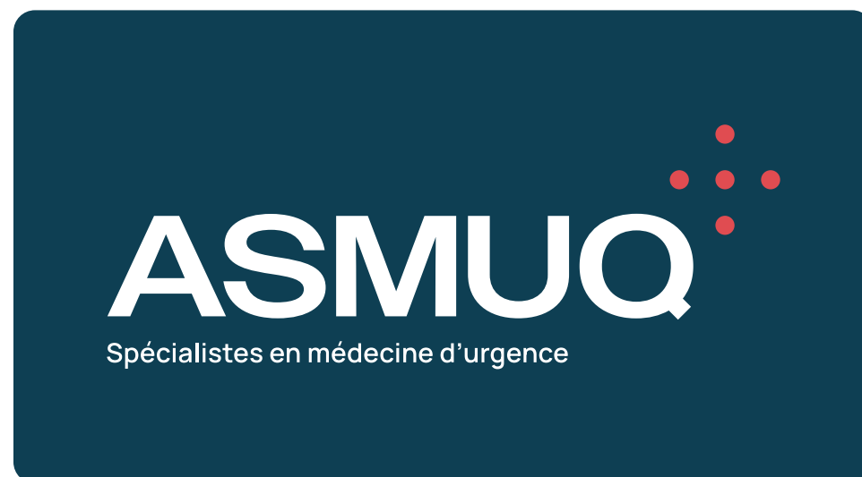
VERSION EN RENVERSÉ